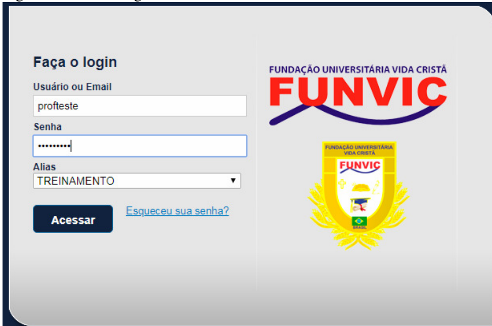
Figura1: Área de Login

Ao logar, entrar no Menu Educacional conforme (figura 2).